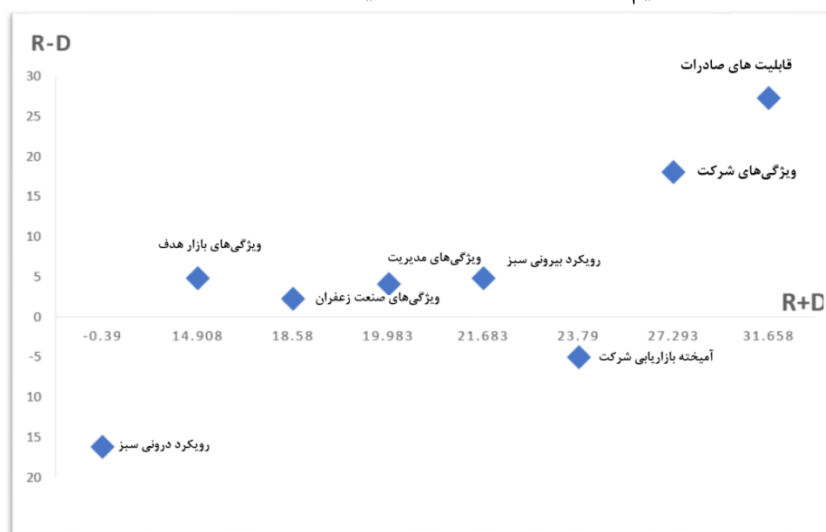
شکل ۳- روابط علی دیمتل

مرحله ششم: در این مرحله می‌توان شکل علی دیمتل را با استفاده از مقادیر اثرگذاری کل و اثرگذاری خالص ترسیم نمود. شکل ۲ نشان‌دهنده این مرحله است.